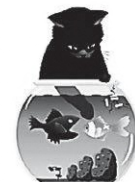
ストレス度が 高い場合の例