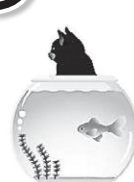
ストレス度が 低い場合の例

イライラする、眠れない、疲れている…最近こんな不調を感じていませんか？ 日々の生活で無理が続くと、こころやからだのバランスが崩れてしまいます。 こころの体温計は、簡単な質問に答えてもらうだけで、いろいろなストレス度や 落ち込み度をチェックすることができます。