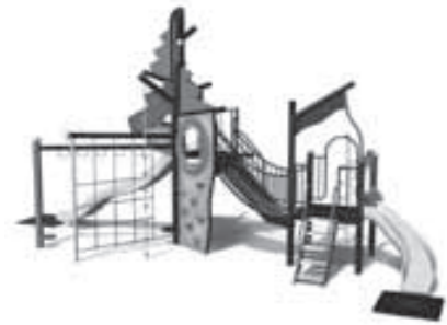
複合遊具イメージ

(仮称) 夢ほたる公園は27年度に開園を予定し、現在開園に向けて整備を進めています。公園内には複合遊具やバリアフリートイレなどを設置する予定です。 町では、住民の皆さんに親しまれる公園でありたいとの思いから、公園の名称を公募します。名称は、募集期間が終了した後、平成27年4月に開園を予定している名称選定委員会にて、皆さんの意見の中から公園にふさわしいものを選定する予定です。