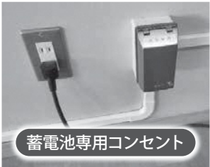
蓄電池専用コンセント

停電発生時、蓄電池の電気は避難スペースとして使用する「体育館」「視聴覚室」「図書室」の専用コン