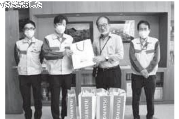
▲福嶋工場長（左から2番目）と前川光町長（右から2番め）