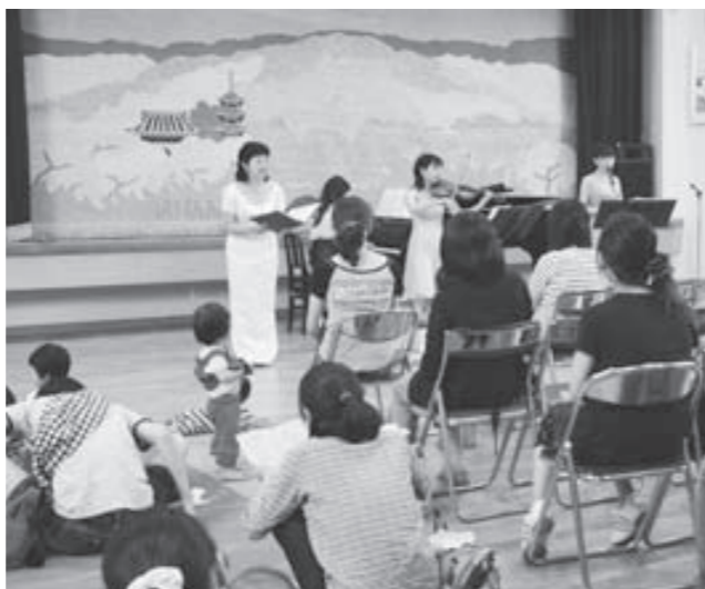
保育所の子どもたちも集まってくれて、まゆまるも嬉しそう

アンケートでは「子どもが入場できるクラシックコンサートはなかなかないので、良い機会でした。」と、あるお母さん。小さな子どもも音楽に合わせて体をゆすったり手を叩いたり、とても楽しそうな姿が印象的な梅雨の合間の一日でした。