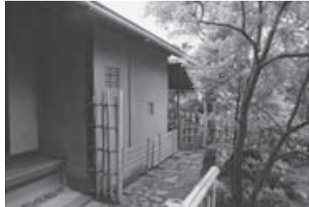
▲ 妙喜庵の国宝「待庵」 ◀ 大山崎山荘「白雲楼」

降、午前9時〜午後5時(昼休みを除く)に電話で左記まで。 問・申込先 11 生涯学習課文化芸術係 ☎956-2101(内225・221)