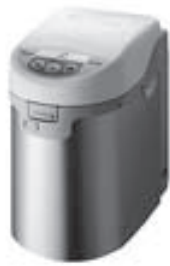
生ゴミ処理機 イメージ

生ゴミ処理機を購入してゴミ減量に取り組み方に補助金を交付します。 ※申請多数の場合抽選。補助金交付決定前に購入したものは対象外 補助金額 ＝機器購入価格の1/2 ※上限20,000円。購入金額が5,000円未満のものは対象外 交付決定 ＝6月中旬 対象 ＝次の要件すべてに該当する方 ○大山崎町民 ○大山崎町内で処理機を利用する ○過去5年以内に当制度の補助を受けていない 申請方法 ＝5月10日(日)～21日(金)8:30～17:00に、▼申請書(役場2階経済環境課に置いてます)▼印鑑▼見積書▼カタログを下記まで持参(郵送不可)。 問・申請 ＝経済環境課(内244)