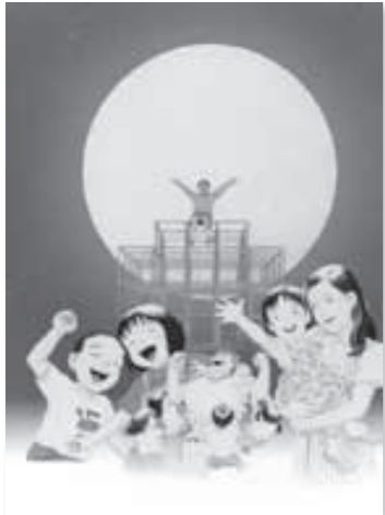
▲映画「どんぐりの家」より

障がい者週間に合わせて、街頭啓発ならびに福祉映画上映会を開催します。ぜひご参加ください。参加無料、申込不要。 【街頭啓発】 とき 12月3日 午前11時～正午 ところ 1 大國屋前、ラブリー円明寺／円明寺郵便局前 【福祉映画上映会】 広報おおよまぎ11月号、15ページの引換券をお持ちいただいた方には、手作りクッキーと記念品をプレゼントします（数に限りあり）。 とき 12月6日 田（午前9時30分開場） ミニ手話教室 午前10時～10時20分 ■映画上映 午前10時30分～午後0時25分 ところ 1 中央公民館本館1階ホール 上映映画 1 「どんぐりの家」 ※本編115分 対象 11 どなたでもお越しください 定員 1100人（先着順） 問 1 福祉課社会福祉係 ☎ 956-2101（内155）