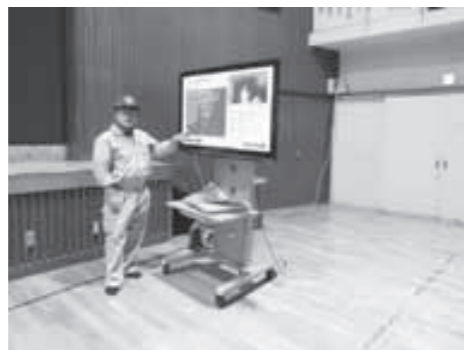
▲第2大山崎小学校ほかにテレビ受信設備を設置しました。

また、平成27年1月18日回には大山崎中学校にて町防災避難訓練を実施します。詳細は1月号で紹介いたしますので、ぜひご参加ください。