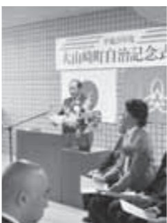
▲11月2日 大山崎町自治記念式典を開催しました。

①ベビーマッサージ（要予約、見学OK） とき＝12月9日 日 10:30～11:30 持ち物＝▼バスタオル▼ハンドタオル▼ベビーオイル ②みんなでランチ とき＝12月11日 日、19日 日 11:45