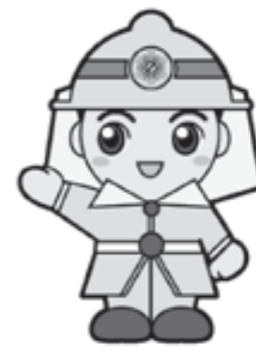
乙訓消防組合 マスコットキャラクター 「こころくん」

着衣着火によるやけどは、気道熱傷を起こやすく、衣服の素材によっては火が着いていることに気が付きにくい場合があります。広範囲にやけどをすることもありますので注意が必要です。