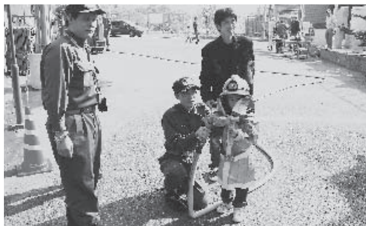
昨年の「おおよまぎ産業まつり」消防団コーナーにて