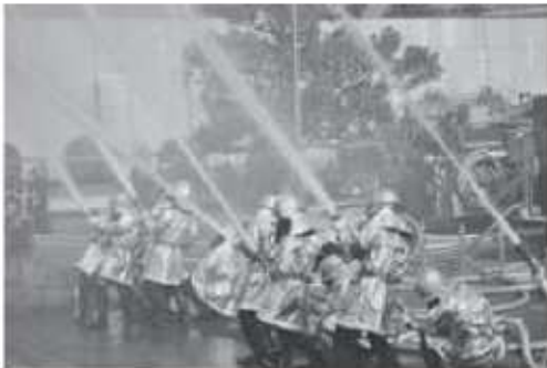
出初式での一斉放水の様子