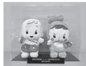
副賞のセンサスクン、みらいちゃんぬいぐるみ

平成27年10月に実施された国勢調査において、本町ではパソコン・スマートフォンからの回答率が高く、調査事務の効率化につながったとして総務省統計局長から表彰を受けました。ご協力いただきありがとうございました。