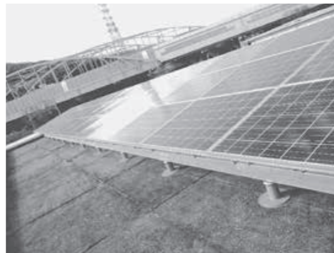
大山崎小学校 屋上

平常時にはクリーンエネルギーとして両小学校に電力を供給し、災害時には非常用電源としての活用が可能となります。