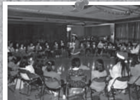
クリスマス会でのキャンドルサービス