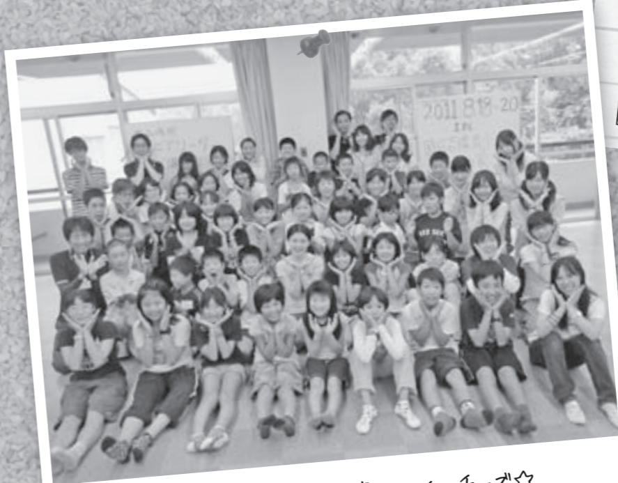
夏キャンプでの集合写真。ハイ、チーズ☆