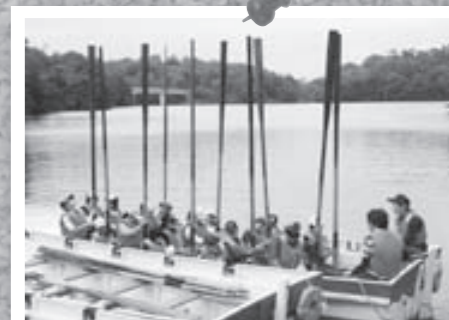
オールを立てて、さあ出発！