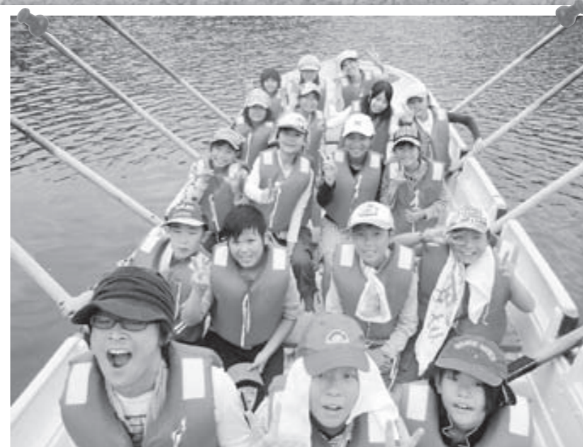
夏キャンプでは、岡山県の国立吉備青少年自然の家でカッター講習をしました♪