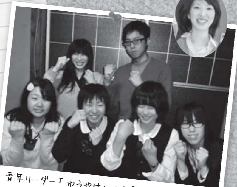
青年リーダー「ゆうやけ」のお兄さん、お姉さんの優しく指導してくれます♪