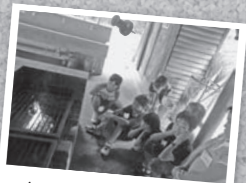
自分たちで火をおこします

養 成講習会の指導、協力はジュニア・リーダーOB・OGの高校生、大学生などで構成される青年リーダー「ゆうやけ」が行います。青年リーダーの活動は35年以上の実績があり、子どもたちは適切なサポートのもと、安心して活動できます。