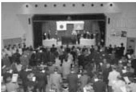
全員で国歌と町歌を斉唱