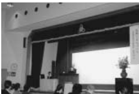
町制40周年記念講演会「芸術とまちづくり」