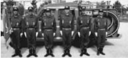
京都府消防操法大会への出場が決定した第一分団の皆さん

大山崎町消防団の代表として、選抜会で優秀賞に輝いた第一分団が出場することに決定。第一分団は、この後も、京都府消防操法大会当日まで訓練に取り組みます。皆さんの熱い応援を、よろしくお願いします。