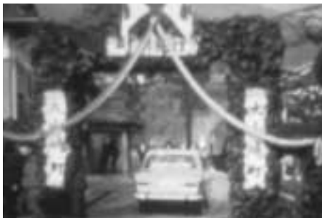
式典に先立って放映した、昭和42年の町制施行記念式典のようすなどを記録した映像