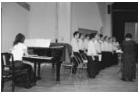
美しいコーラスを披露していただいた「エコーおとくに」の皆さん