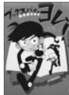
『秘密図書委員(ブックスパイ)・ヨム!』 杉山 亮 / 作

ぼくの名前は読(よむ)。こんな名前だけど本は読まないぼくが、図書委員になってしまった。その上、黒ずくめの男に秘密図書委員(ブックスパイ)にスカウトされた。校長先生のオーケーもあってあるって、一体何なの???