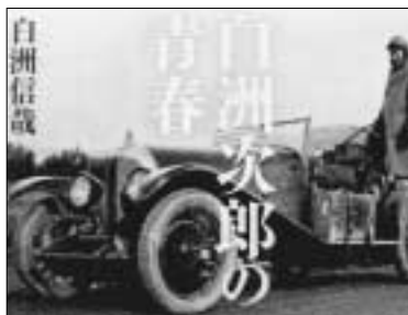
『白洲次郎の青春』 白洲 信哉 / 著

17歳で英国に留学した白洲次郎。9年間にわたる英国生活の中で、彼は何を見、聞き、感じたのか。白洲家に遺された1冊のアルバムを手掛かりに、孫の信哉が祖父の足跡を訪ね歩く。