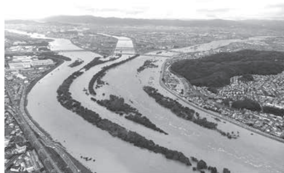
平成25年 台風第18号 (平成25年9月16日) 三川合流付近

今年も集中豪雨や台風等が猛威を振るう季節を迎えました。大雨や台風などは、ある程度事前に予測することが可能ですが、発表される情報の意味を正しく理解していないと、対応が遅れ、最悪の場合、命を落とすことになりかねません。