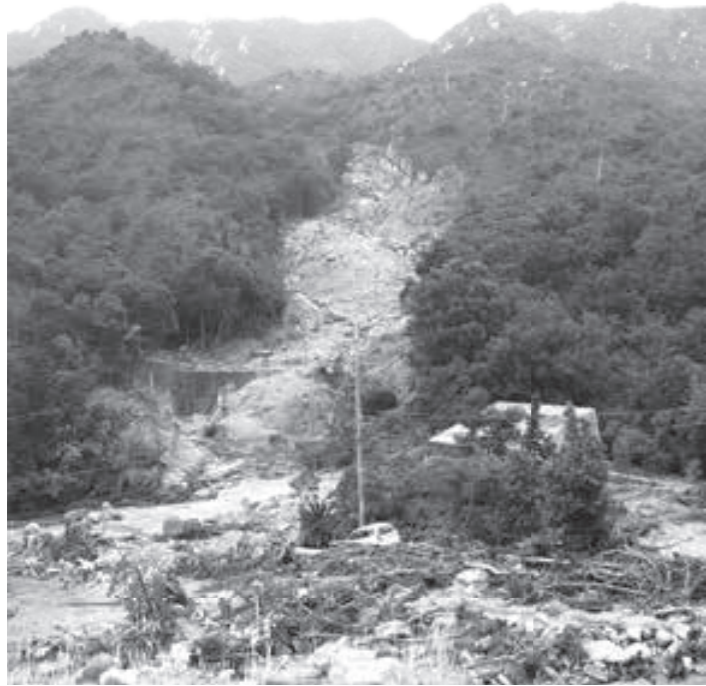
平成21年7月中国・九州北部豪雨

配信の開始日 6月15日(木) 配信エリア 大山崎町全域 配信する情報 桂川下流において河川氾濫のおそれがある(氾濫危険水位に到達した) 情報及び氾濫