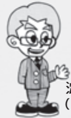
天王山のぼる君 (14) 淀川散歩さん (63)