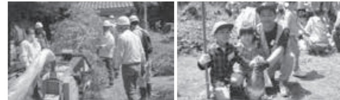
▲粉砕機で竹をチップに