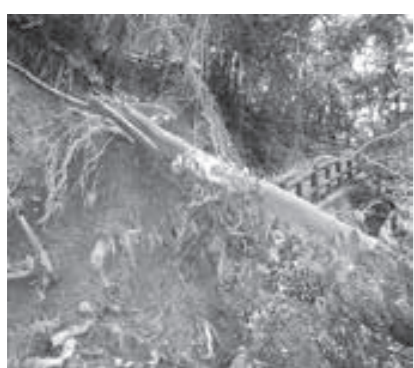
平成27年台風11号 天王山ハイキング道の倒木

難所か頑丈な建物の2階以上へ避難しましょう。避難が難しい場合には、山の斜面から離れた2階以上の部屋へ移動してください。また、夜間に非常に強い雨が降っている場合は、避難情報などが発表されていなくても、自宅の2階で過ごすなど、身の安全を図ってください。