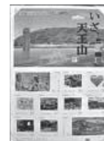
▲手紙に貼るもよし、コレクションにするもよし

宝積寺やアサヒビール大山崎山荘美術館などがあしらわれ、町の魅力がぎゅっと詰まった10枚セット。本町と連携をすすめている龍谷大学の学生が考案した「ハートのかたち大山崎」のデザインも人気です。この切手は、乙訓地域の郵便局で販売しています。