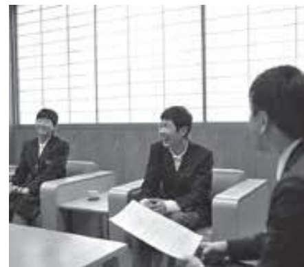
▲スポーツのこと、学校生活のこと、話は尽きません

ポジションはサード。速い球が飛んでくる、難しい場所を任されています。また、6番バッターとしても活躍。「バッティングは得意。上手く打