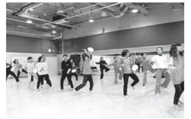
▲エイサーに挑戦だ！

児童たちは、「色々な競技を体験できてよかったです。」と、新しい刺激に大興奮のようす。彼らの今後の活躍が楽しみです。