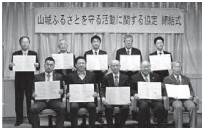
▲(後列左から)山城広域振興局副局長、(社)大山崎町社会福祉協議会長、大山崎町長、布亀(株)部長、ワタミ(株)京都南営業所京都第二支部長、(前列左から)京都新聞大山崎販売所長、読売新聞大山崎販売所長、産経新聞大山崎販売所長、(前)中河乳業代表取締役社長、(公社)大山崎町シルバー人材センター理事長

地域の事業者や他団体と協力して、高齢者の皆さんに安心をお届けできるよう、これからも取り組みを進めていきます。