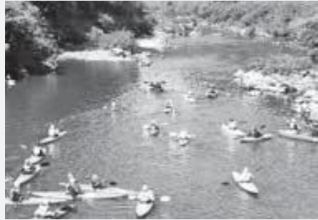
▲昨年度のカヌー教室のようす