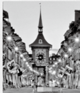
▲～目覚ましからランドマークまで必ず調整しなければなりません～ ※ベルリン都のツィットグロッツェ塔

僕は、スイスに住んでいたとき、サマータイムについて特に意見を持っていませんでした。しかし実を言うと、日本ではちょっとだけ欲しいです。いつも夏は、朝4時に明るくなり始め、夜もすぐ暗くなるので個人の睡眠周期に波風が立つからです。