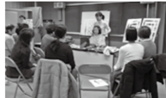
▲色によって顔の印象もがらりと変わります。目で見てよくわかる講座でした。

似合う色をまとうことで、肌の透明感が増し血色がよく見えるだけでなく、フェイスラインがすっきりしたり、シミや皺が目立たなくなったりする効果があることもわかります。みなさんも機会があれば、ご自分の洋服やメイクの色を見直してみたいかがでしょうか。