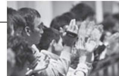
我が子のカッコイイ姿を記録しようと、ビデオカメラを構えるお父さん、お母さんの姿も見られました