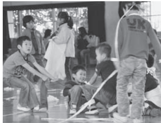
家で同じことしたら怒られるから、ダメだよ（笑）

体に巻き付けて衣装にする子、丸めてボールにして遊ぶ子、ロープを作って縄跳びをする子。ひっぱって、破って、結んで、切って、巻き付けて…。豊かな感性と自由な発想で、普段はあまり遊び道具にはならないであろう「布」で、みんな元気いっぱい遊びました。