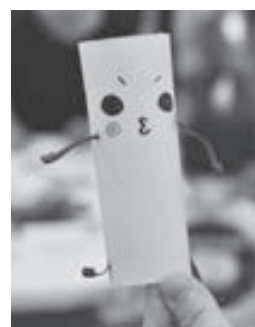
トイレトーパーの芯で作った人形。この表情、どこか癒されます