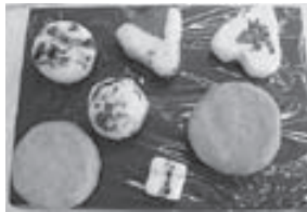
エゴマセッケンの例

昨年度から始まった「荏胡麻まるごと体験事業」。今年度は、エゴマの特色を生かした、よりユニークな活動を展開しています。その中から、広く体験していただける内容を選び、ワークショップを開催します。 とき=12月12日 日 10:00~12:00 ところ=離宮八幡宮