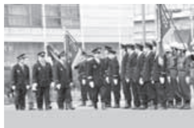
▲平成25年、消防部隊観閲のときのようす

文化財を火災から守ろう 1月26日は「文化財防火デー」 昭和24年1月26日、日本最古の壁画が描かれた奈良県法隆寺金堂が焼失。かけがえのない文化財の損失は日本中に大きな衝撃を与えました。大山崎消防署および大山崎町消防団は、町内の貴重な文化財を後世のひとびとに伝えていくため、「文化財防火運動」で火災予防を呼びかけます。貴重な文化財を火災から守るため、皆さんのご協力を願います。