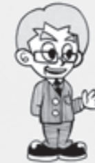
天王山のぼる君 (14) 淀川散歩さん (63)