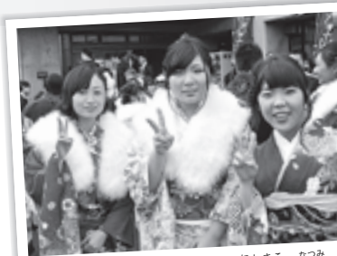
もろ 彩香さん、あやの 月形 優香さん、にしき 西佐小 夏未さん、だれかのため 看護師 楽しく生きる