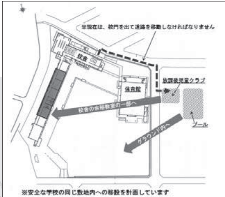
イメージ図(移設計画案)

一方で、放課後児童クラブの運営場所としても、全国的にみると小学校の余裕教室を活用する例は全体の29%(平成28年)にのぼり、今後のこうした余裕教室の望ましい活用例として、文部科学省や厚生労働省でも、そのひとつに「放課後児童クラブ」をあげています。