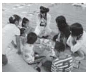
▲昨年のワークショップのようす

京都造形芸術大学の学生が企画、運営する夏のイベント。ライトアップと展示、ライブを行います。 ※参加無料 ■ワークショップ 「灯籠つを作ろう!」 睡蓮のつぼみをイメージしたオリジナル灯籠つを作ります。イトアップにも使われます。 ※要予約。電話で下記申込先まで とき 8月11日(日) ①午前10時～正午 ②午後1時30分～3時30分 ところ 中央公民館 ■ライトアップ とき 8月23日(金)～25日(日) 午後7時～9時 ところ 離宮八幡宮境内 ■展示 とき 8月23日(金)～25日(日) 午後1時～9時 ところ 離宮八幡宮旧社務所 ■ライブ とき 8月25日(日) 午後5時30分～8時 ところ 離宮八幡宮境内 問・申込先 京都造形芸術大学プロジェクトセンター 澤村 ☎791-8763 【同時開催】 ■えごまCafe & ワークショップ ※申込不要 とき 8月25日(日) 午後2時～4時 ところ 離宮八幡宮境内 主催 へごまクラブ ■友あそびのゆかた茶会 とき 8月25日(日) 午後4時～7時 ところ 離宮八幡宮境内 一席 300円(お菓子付) 主催 大山崎町の歴史・文化遺産を活かした地域活性化実行委員会