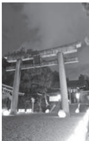
▲昨年のライトアップのようす