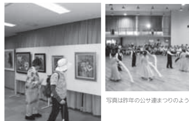
写真は昨年の公サ連まつりのようす