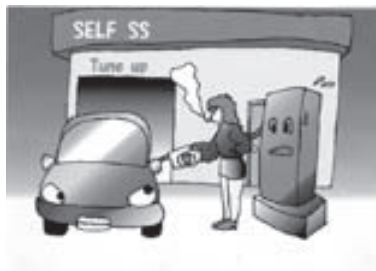
こんな危ないことしてませんか?

○給油キャップの置き忘れに注意。うっかり給油キャップを閉め忘れたまま走行すると、給油口からガソリンや可燃性蒸気が漏れてとても危険。