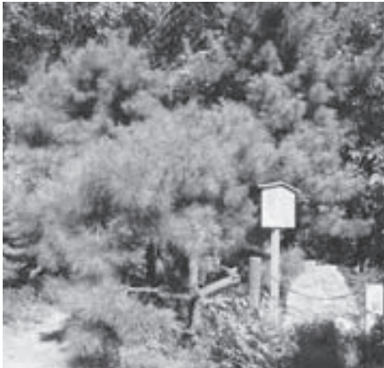
（上）天王山遠景（下）旗立松。合戦の際、秀吉が 味方の士気を高めるため、この樹に干成ひょうた んの旗印を掲げたと伝えられています