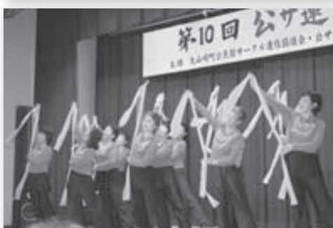
写真はいずれも昨年の公サ連まつりのようす