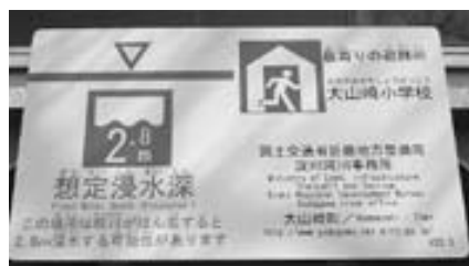
中央公民館に設置した看板