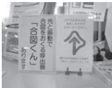
▲このマークと看板が目印です

住民票の発行などを行う、窓口・年金係の窓口を設置しています。ご利用を希望する方はお気軽にお申し出ください。 問11福祉課社会福祉係 ☎956-2101（内154）