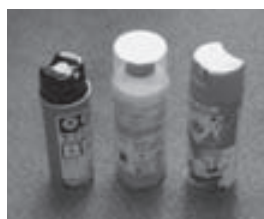
▲エアゾール式簡易消火器具 住宅用消火器▶