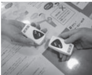
▲大きさはこれくらいです