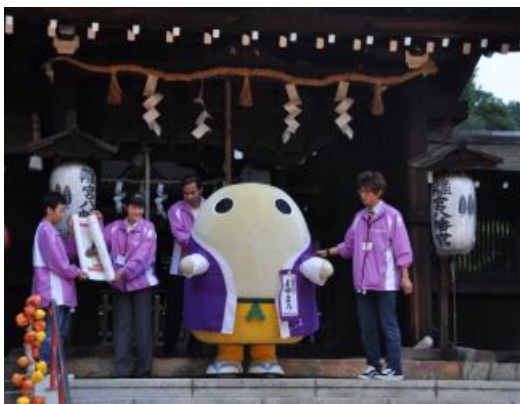
PR隊長 まゆまろの登場！