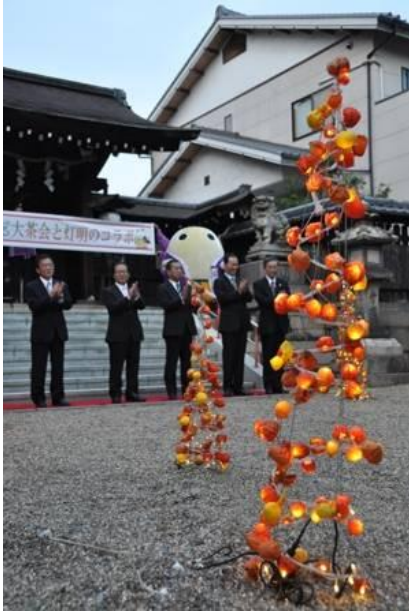
照明を消して、午後5時に合わせて灯明アートを点灯。