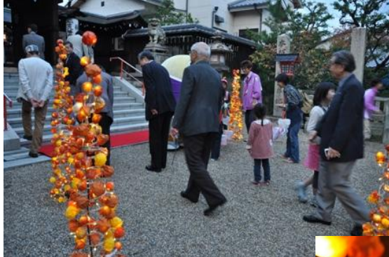
辺りが暗くなるにつれ 灯明アートが輝きを増します。