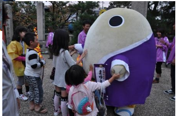
会場の子どもたちにも大人気だったまゆまろ。