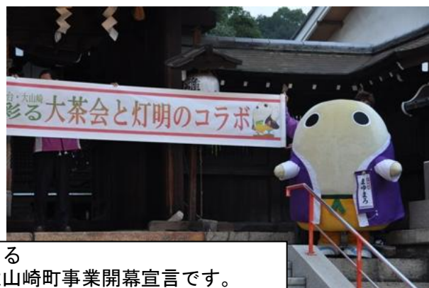
まゆまろによる 国民文化祭大山崎町事業開幕宣言です。