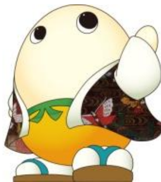
国民文化祭PR隊長「まゆまる」