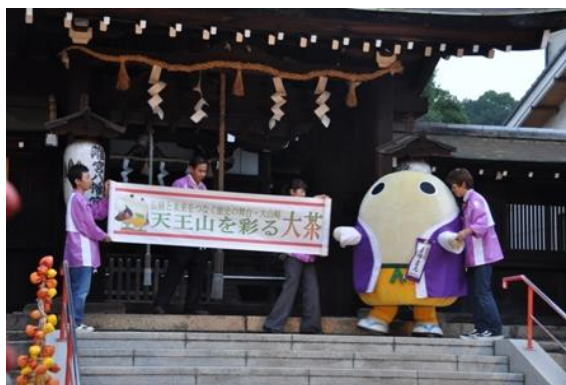
スルスルっと横幕がひろがって…