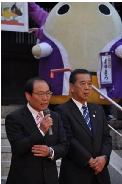
実行委員会を代表し、開会の挨拶 を行う会長（町長）。