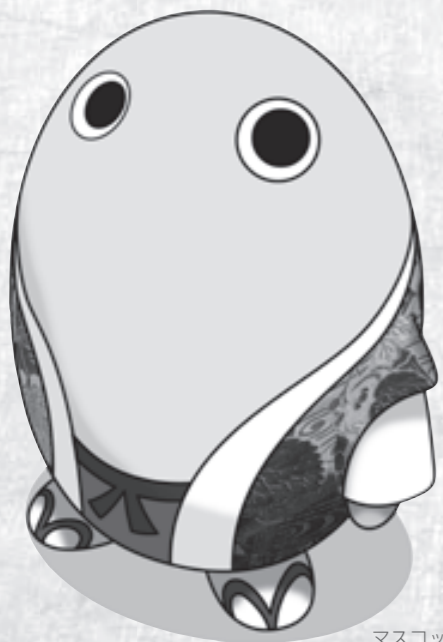
マスコットキャラクター「まゆまる」