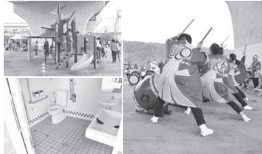
右) オープニングイベントでは太鼓やダンス、歌が披露されました 左上) 楽しい遊具がお迎えます 左下) 広いトイレを併設しています