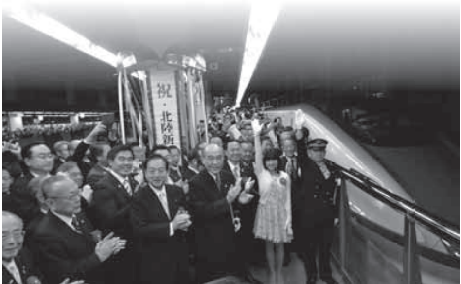
3月14日の金沢駅ホーム。待望の北陸新幹線開業を多くの方が祝福しました。

す。」と助言をいただきました。 「自分の後ろには1,000人近くのお客様がいます。安全第一で、体に気を付けて、長く乗り続けたいですね。」