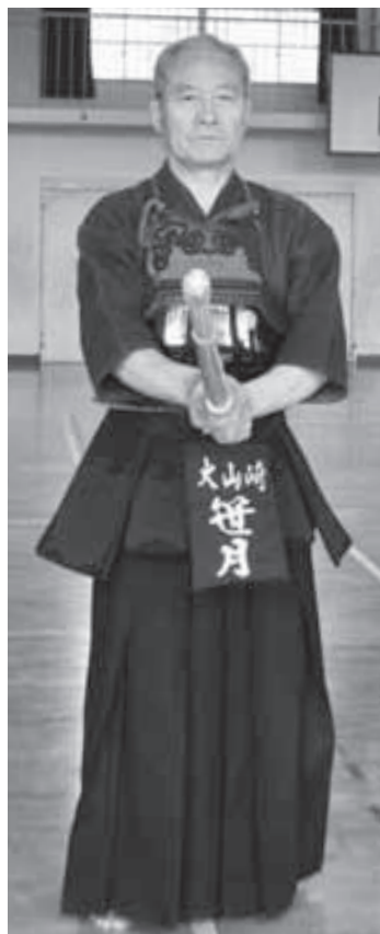
74歳で 剣道八段に 昇進