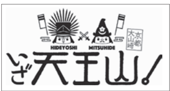
▲左が豊臣秀吉、右が明智光秀です。

羽柴秀吉と明智光秀が戦った山崎合戦（天王山の戦い）に由来し、「天王山」は、こころ一番の勝負の代名詞となつていきます。そこで、何かに挑戦する人を応援する「勝負の聖地」として大山崎町をPRし、町を活性化させるために、このたび「いざ天王山」ロゴマークを作成しました。