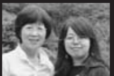
関東に在住の母娘

高校生の皆さんが綺麗なお茶をたててくれるのに、感心しました。子ども茶会で、お子さんが先生の言うとおりに一つひとつの動作を丁寧にまねするのが、かわいかったです。とても素直なお茶で、やさしい気持ちになりました。