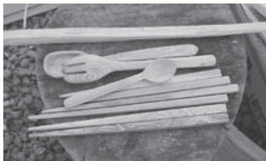
▲餅つきの様子 ▼昨年のもくエゴマ油復活プロジェクトの作品

木工ワークショップ もっちり大会 天王山の間伐材など、さまざまなものを利用してお箸やスプーンなどの小物を作り、仕上げにエゴマ油を塗ります。手作りにした作品はお持ち帰りできます。おまけもあるかも! とき 12月10日(土)午後1時～2時30分(当日受付) 参加費 200円(傷害保険などは各自加入) 持物 2エプロン 2軍手 2タオル 2ウエス(エゴマ油を塗る綿布) 定員 20人(先着順)