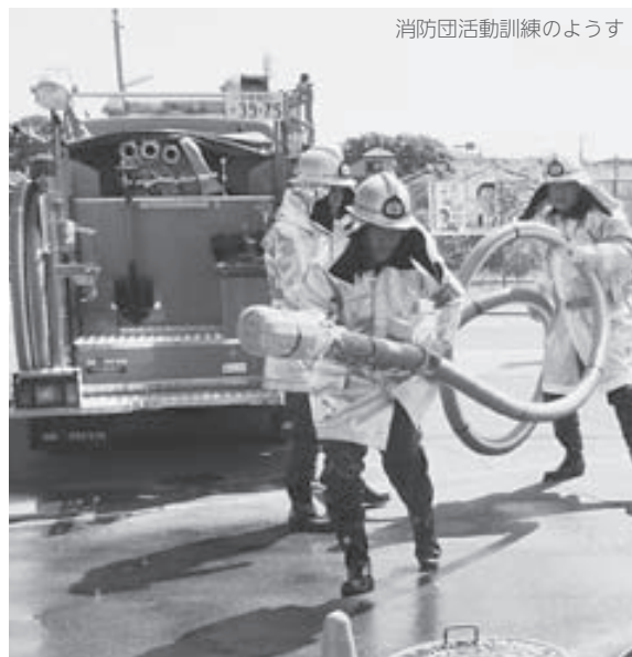
消防団活動訓練の様子

消防団は、地域の安心・安全を確保するため、地域の住民によって組織されています。消防団員は、普段はそれぞれの職業に就きながら、災害が発生したときには、いち早く現場に駆けつけ、消火活動や救護などにあたります。まさに、地域の防災になくはならない人たちです。