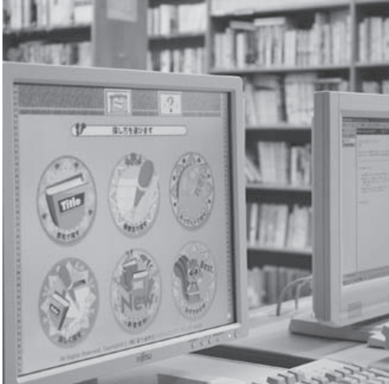
検索用コンピューターは、図書室を 入ってすぐ左側に設置しています