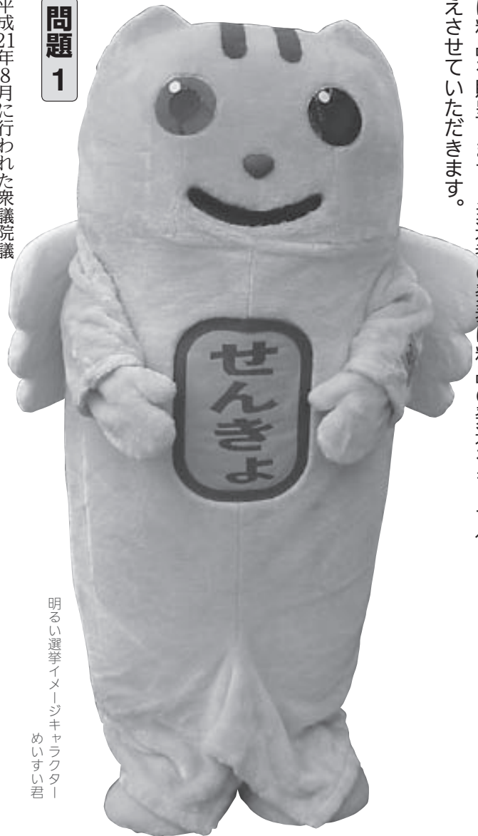
明るい選挙イメージキャラクター めいすい君

選挙に関するクイズです。全問正解者の中から抽選で20名様に粗品を贈呈します。当選者の発表は粗品の発送をもって代えさせていただきます。