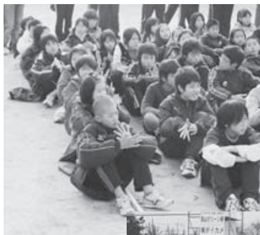
(上) スタート直後、勢い良く駆け抜ける選手たち (中) 走り終え、表彰式で並んで座る大山崎小、第二大山崎小の選手たち (下) 3位でゴールを切る第二大山崎小のアンカー