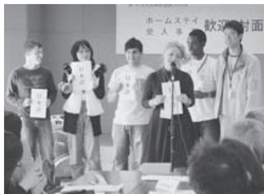
(上) 流ちょうな日本語で寸劇を披露する研修生たち (下) お別れの前に、ホストファミリーと研修生全員で記念撮影をパシャリ

歓迎・対面式が終わると、研修生とホストファミリーはそれぞれ京都見物に出かけたり、家で団らんを楽しんだりして、1日という短い時間の中でめいっぱい交流を深めたようです。研修生からは、「家族の皆さんはとても親切でした」「いろいろな日本料理を食べられて嬉しかった!」といった感想が多く寄せられました。実りの多い国際交流体験だったことでしょうね。