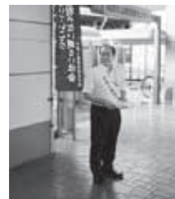
▲8月6日 人権街頭啓発を阪急大山崎駅前で行いました。

法人税割の税率の改正に伴い、平成26年10月1日以後に開始する最初の事業年度、または連結事業年度の予定申告に係る法人税割額については、予定申告税額を求める算式の「6を乗じる」部分が次の値となります。 ○町民税…「前事業年度分の法人税割額×4.7÷前事業年度の月数」 問＝税住民課税務係（内141）