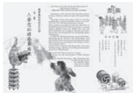
▼壬生六斎念仏踊りのパンフレット。英語でも解説が書かれています

特に「獅子舞」の芸は六斎念仏おどりのトレードマークともいえる出し物で、獅子舞が様々なアクロバットを披露した後、蜘蛛と対決します。