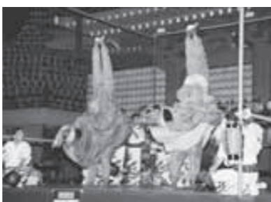
▶「壬生六斎念仏踊り」の一場面（参考）。左は、蜘蛛と対決しているところ。