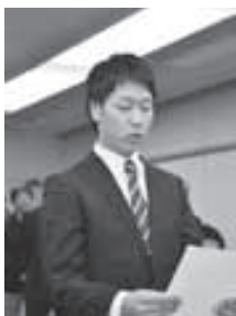
▲4月1日 16:00。新規採用 職員の代表が、町職員 としての決意表明を述 べてくれました。

活動期間=7月~平成27年6月 対象=淀川や桂川に行き、見たこと や感じたことを月1回以上報告でき る、淀川か桂川の近くに在住の20歳 以上の方 謝礼=月4,500円程度 申込方法=ホームページで受け付け。 詳細はホームページか下記まで。 問=淀川河川事務所管理課 ☎072-843-2861 〓http://www.yodogawa.kkr. mlit.go.jp/