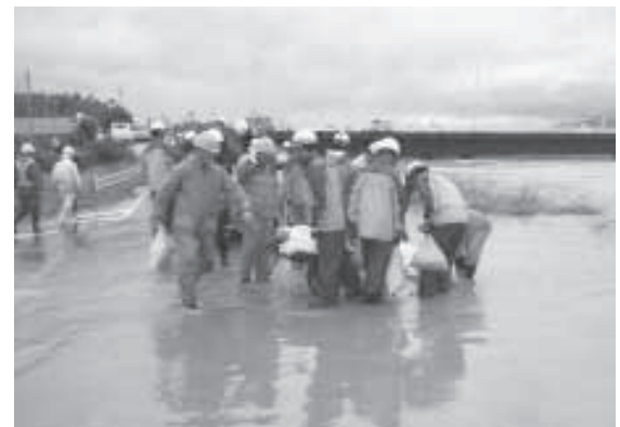
▲平成25年9月16日/台風18号の影響で溢水した桂川の様子

「にぎって来た」、「流木や落ち葉がながれてきた」場合は、上流付近で大雨が降っているかも！雷が鳴ったり雨が降り始めたら、急いで安全な場所に移動してください。