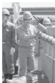
▲5月10日、桂川・小畑川水防訓練に参加しました。

雨は記憶に新しいところですが、こうした集中豪雨の発生は、長期的には、地球温暖化防止に向けた環境対策の必要性を私たちに示しており、目の前の課題として、防災・減災への取り組みを一層進めなければなりません。 災害時には、まずは何よりも自分のことは自分で守るという「自助」と、自分たちの地域は自分たちで守るという「共助」を基本に、町を始めとする公的機関による「公助」を合わせて、災害対応を図る必要があります。町では、現在「共助」を促進するため、自主防災組織の組織化と育成支援を重点施策として進めています。 危機管理には、安きにありて危うきを思う「居安思危」と、備えあれば憂いなしの意味を持つ「有備無患」の心構えが必要となります。この機会に、近所同士で日頃の「備え」と心の「構え」について、話し合ってみてはいかがでしょうか。