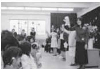
▲4月10日 京都がくえん幼稚園の入園式に出席しました。