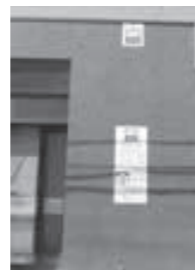
◀JA京都中央 大山崎支店