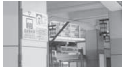
▲阪急電鉄(株) 大山崎駅