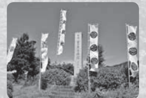
③決戦地 笹尾山から目と鼻の先にこちらの決戦地があります。三成公の首をとるべく絶え間なく攻める東軍と、必死に応戦する西軍とが最後まで戦った合戦最大の激戦地でした。