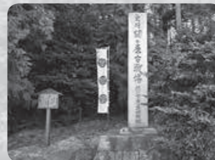
①桃配山(徳川家康最初陣地) 東軍の徳川家康公が関ヶ原合戦の際、3万の兵を率いて最初に陣を構えたのがこの桃配山です。