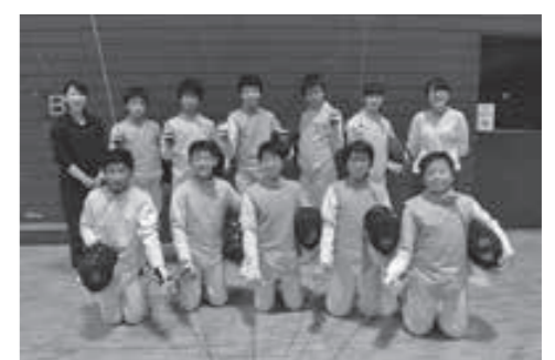
大山崎中学校フェンシング部の皆さん