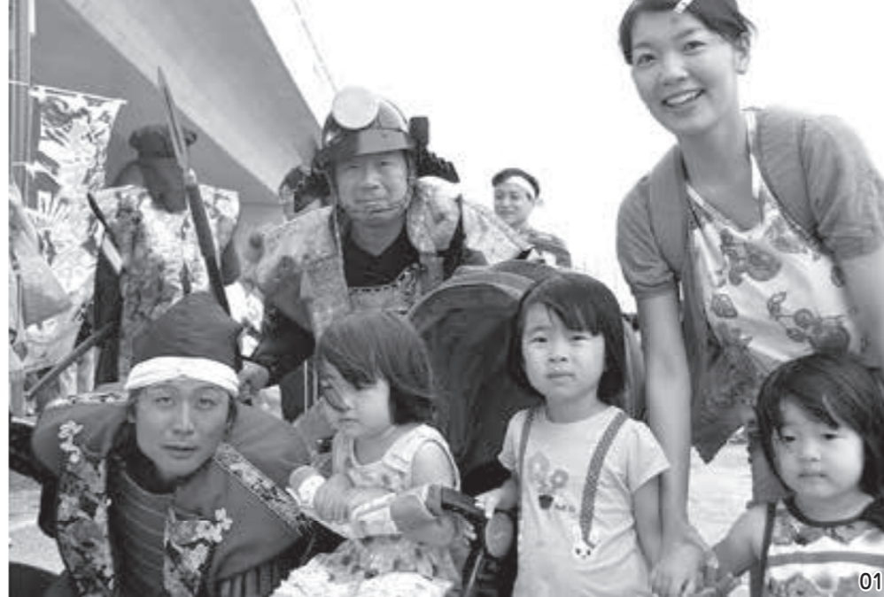
01.「乙訓戦国つじ」の秀吉らと一緒に 02.詰めかけた大勢の観客の前でのびのびと演奏する大山崎中学校吹奏楽部 03. purple☆の庄巻のパフォーマンス 04.御歌頭さんのライブペインティング 05.いいにおいにつられて並んでしまいます 06.パネルに顔をはめて、気分は秀吉!? 07.大山崎町と関ヶ原町、どっちが「天下分け目」の地?