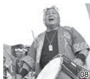
08.「和太鼓つくどん」の打音と掛け声で会場は一体に 09. 天下統一も夢じゃない? 10. 兜はイヤ! 11.チャンバラ「山崎合戦」が強いと褒められ笑顔に 12.優勝を賭けて、いざ出陣! 13.大人気の「六文ジャー」 14.戦国時代に思いを馳せて(丹波亀山鉄砲隊による火縄銃演武) 15.乙訓戦国つじが秀吉VS光秀、因縁の対決を今ここに再現