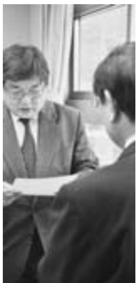
町の将来を思い、議論を尽くして答申を作成していただきました。ありがとうございました。

▼2月17日／総合計画第3期基本計画審議会 答申▼2月20日／桂川クリーン大作戦▼2月24日／町議会第1回定例会開会▼3月6日／二市一町総合消防訓練▼3月15日／大山崎中学校卒業証書授与式