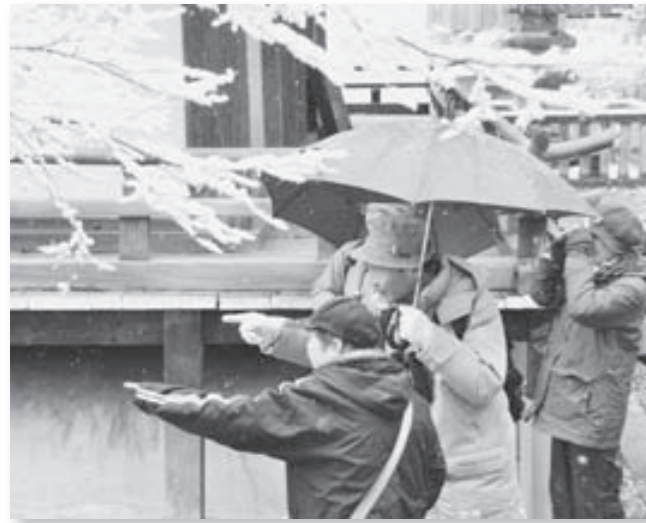
指をさして野鳥を確認する参加者の皆さん

約2時間のバードウォッチングで、コゲラ、ヒヨドリ、ジュウビタキ、ツグミ、ウグイスなど約18種類の野鳥を確認。講師の楽しい解説もあり、参加者は自然と触れ合う楽しい時間を過ごしました。