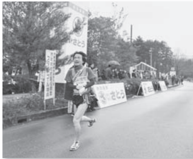
ゴールに駆け込み、安どの表情を浮かべる大山崎町のアンカー