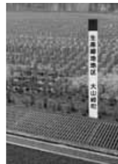
※指定杭イメージ写真

本町では、平成22年度から5年間にわたり、国からの交付金である旧「まちづくり交付金」制度を活用した道路や公園などの整備、ボランティア活動支援などを行ってきました。これらの事業を行う際は、都市再生整備計画を定めることになっていきます。これは事業実施前に目標となる数値を設定し、計画最終年度に事後評価を行い、計画の達成状況を確認するとともに今後のまちづくりのあり方を検討するものです。 このたび「都市再生整備計画事後評価シート(案)」を作成しましたので、この原案に対する皆さんの意見(パブリックコメント)を募集しています。 募集期間 平成26年12月17日 迄 平成27年1月17日 迄 公開方法 II町ホームページでの公開および町内各施設への配置による閲覧 ※意見の提出方法など、詳細は町ホームページをご覧ください 問・受付II建設課都市計画係 ☎956-2101 (内256) ☎956-0131