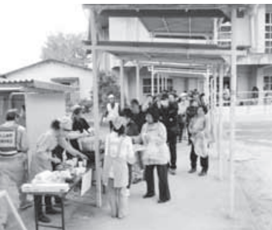
昨年度の防災避難訓練の様子(第二大山崎小学校)

見学参加は町内全域から可能です！ 午前10時50分頃〜11時50分頃には、大山崎中学校のグラウンドなどで大山崎消防署、警察、町消防団による体験型の訓練や消防車両の展示などを行います。対象区域以外の方もぜひ見学にお越しください。