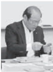
▲4月28日㊦。中学校で試行的に導入しているスクールランチを試食しました。

▼4月8日／第二大山崎小学校入学式 ▼4月19日／いいき朝市タケノコ祭 ▼5月3日／乙訓文化芸術