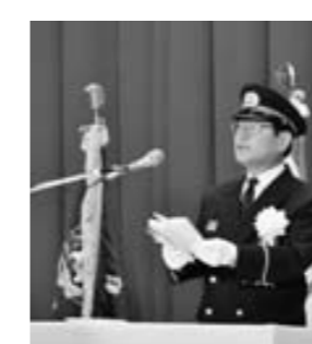
▲制服を着ると、より一層気が引き締まる思いです

▼12月19日/町議会第4回定例会本会議(閉会) ▼12月28日/年末仕事納め訓示 ▼1月4日/新年仕事始め訓示 ▼1月6日/鳥居前古墳発掘調査現場視察 ▼1月8日/消防出初式 ▼1月9日/大山崎町成人式