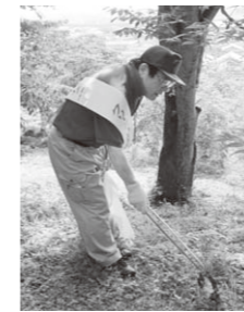
▲5月30日、ゴミゼロ運動の一環で、町内道路の清掃作業を行いました。