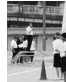
▲9月11日 中学校体育大会に出席しました。

▼8月25日/京都府管水道要望活動 日/議会(開会) ▼9月3日~5日/町議会一般質問 ▼11日/大山崎中学校体育大会