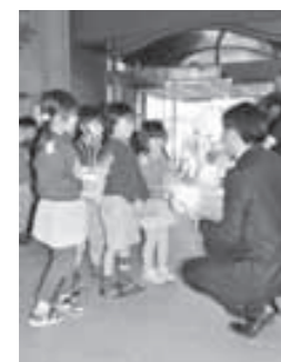
▲2月27日 園、がくえん幼稚園の子どもたちが、みんなで育てた人権の花・スイセンを持ってきてくれました。