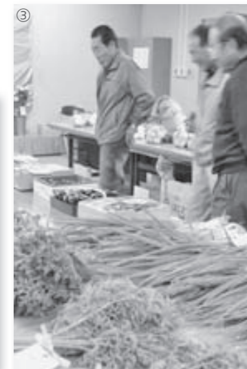
①一日商店街。いろいろなお店が一堂に会しました。②消防コーナー。消防隊員になりきり、消火活動を体験。③いきいき農業まつり。みずみずしい野菜が並んでいました。