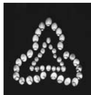
国文祭のとき、竹林ボランティアの皆さんが作ってくれた竹の灯りアート。町章の形をしています。