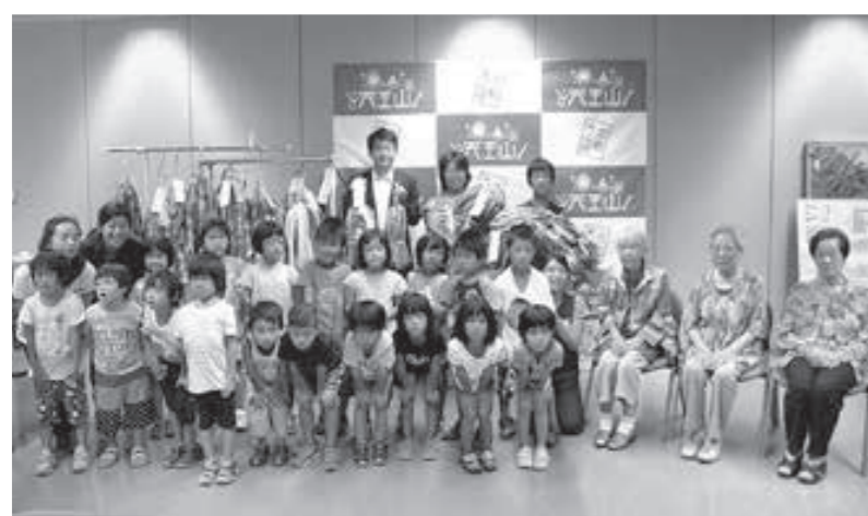
▲7月27日開催の平和の折鶴委託式の様子