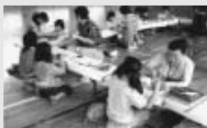
地域子ども教室推進事業「牛乳パックの再利用」。ものづくりを通して、資源を大切にすることを学びます。

現在、ひとつの目標があるんです。空き缶のプルタブを集めて、車椅子に換えることです。会員や近所の方のご協力をいただき、少しずつ目標に近づいています。プルタブ集めは、本当に身近にできることです。皆さんも、一緒にいかがでしょうか。