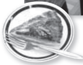
◀参加者の皆さんが作ったガレット・ デ・ロワ。甘すぎず、さっぱりとし たおいしさでした。