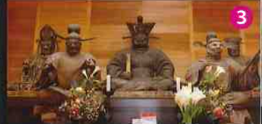
一寸法師伝説の寺 宝積寺(宝寺) 鎌倉時代作・本一の閻魔王像と眷族像は必見。