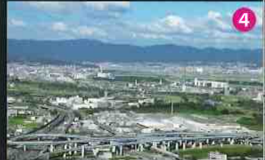
山崎合戦の古戦場が一望のもと 旗立松展望台

お勧め散策コース 山麓コース 約4km・2.5時間 JR山崎・阪急大山崎駅 スタート 大山崎町歴史資料館 ▶ 離宮八幡宮 ▶ 妙喜庵 ▶ 大念寺 ▶ 宝積寺(宝寺) ▶ 青木葉谷展望広場 ▶ 旗立松展望台 ▶ 観音寺(山崎聖天) ▶ アサヒビール大山崎山荘美術館 ゴール JR山崎・阪急大山崎駅