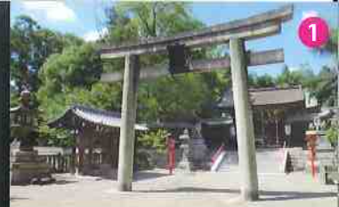
精油発祥の神社。 中世に油座の本所があった 離宮八幡宮 油の神様。油断・敵お守り授与。