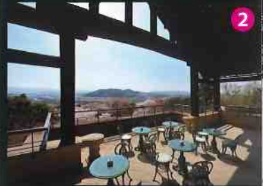
庭園、建物、数々の美術品で癒されて ください アサヒビール大山崎山荘美術館 建築家・安藤忠雄氏設計の「地中の宝宝箱」も必見。