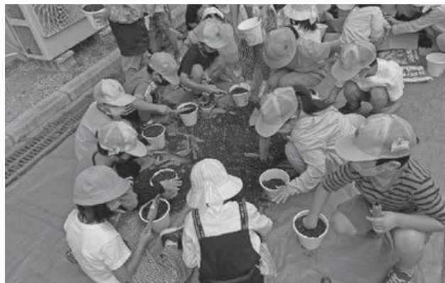
令和4年度「人権の花」運動で水仙等を植える子どもたち