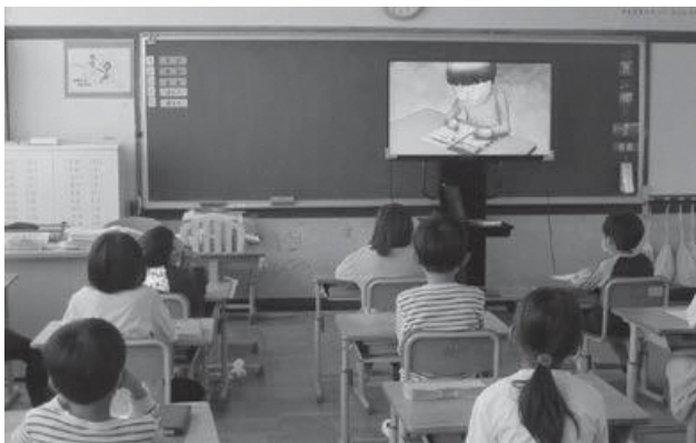
令和4年度「人権の花」運動で人権学習をする子どもたち

・町内の幼稚園や小学校において「人権の花運動」を実施し、人権の花の「水仙」等を育てることなどを通して、子どもときから人権について触れる機会を育んでいます。