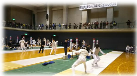
少年少女フェンシング大会

天王山と三川合流地点の地形に恵まれた町の美しい自然と豊かな歴史を活用し、自分の住んでいる地域への愛着や誇りをはぐくむとともに、様々な取組や町内にある数多くの文化財に興味・関心を持ち、郷土の歴史や伝統文化を受け継いでいきます。