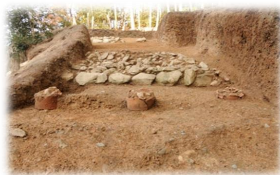
鳥居前古墳の埴輪