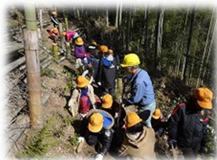
校外学習（町域内）の様子

大山崎町には、豊かな自然や歴史と数々の文化遺産があり、学校においては、こうした郷土の歴史・伝統文化の素晴らしさを活かした教育活動を取り入れる学習を推進します。自然・歴史、伝統・文化を尊重し、それらをはぐくんできた私たちのふるさと大山崎を大切にすることを養い、郷土や地域への愛着や誇りに思う意識の醸成と後世への継承・発展する取組を推進します。