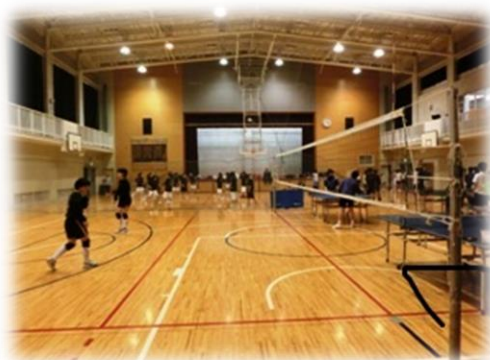
大山崎中学校体育館

学校施設を整備・充実し、質の高い教育が効果的に実施される環境づくりを推進します。