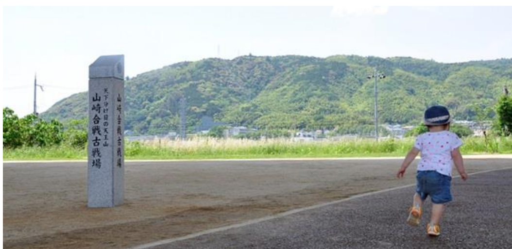
天王山夢ほたる公園