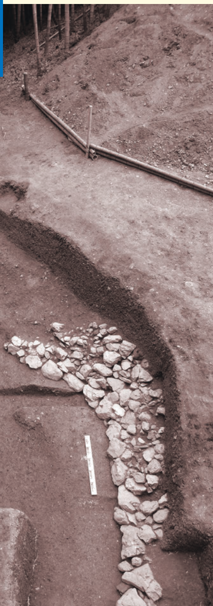
東側クビレ部第1段・第2段斜面（北から）