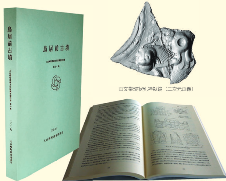
画文帯環状乳神獣鏡（三次元画像）