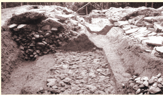
竪穴式石室断ち割り調査（東から）