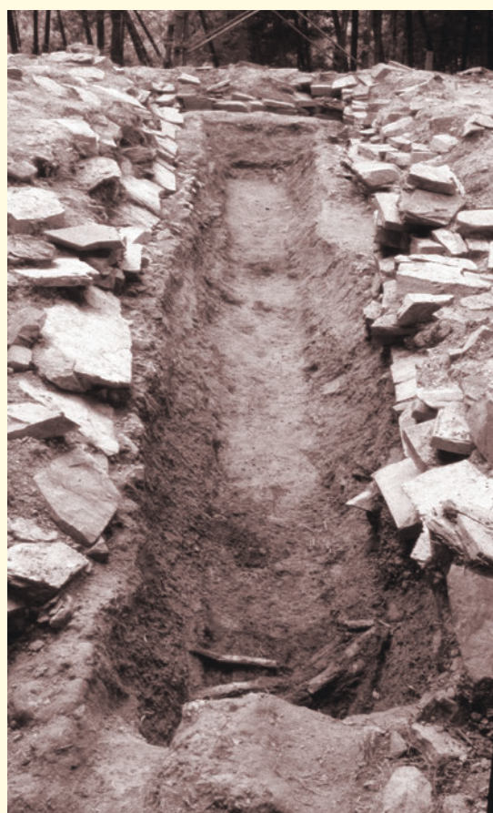
竪穴式石室副葬品出土状況（東から）