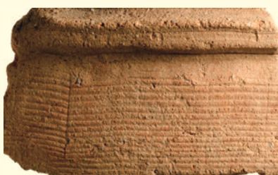
出土した円筒埴輪片